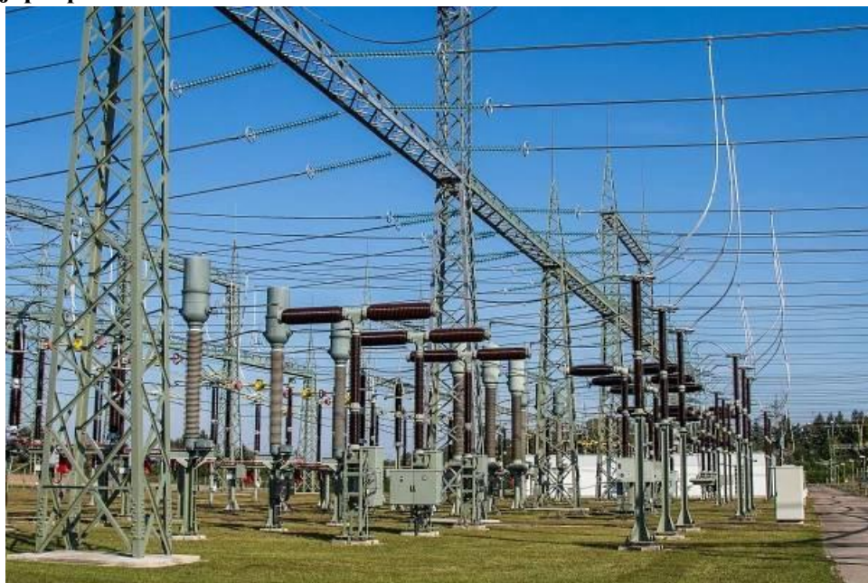
Ilustrační obrázek zamýšlené transformovny